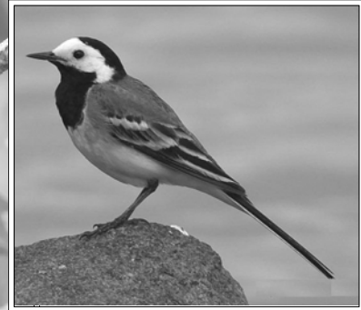
أبو فصاد المصرى