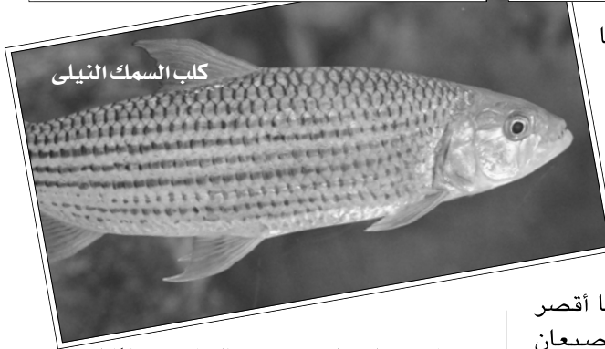
كلب السمك النيلى

تساعده على ذلك سرعته الفائقة؛ نظراً لجسمه الانسيابي. لا يوجد طازجاً فى السوق، بل يباع مملحاً على صورة ما يسمى بالملوحة.