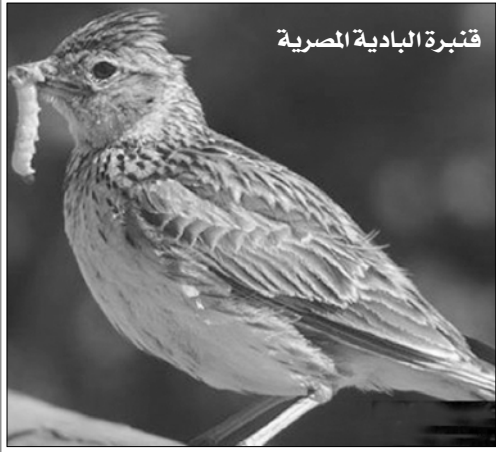
قنبرة البادية المصرية