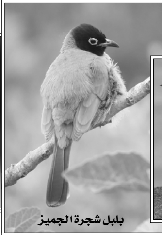
بلبل شجرة الجميز