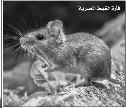
فأرة الغيظ المصرية