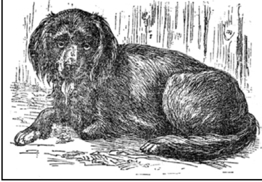
كلب مصاب بداء الكلب (النوع الصامت)